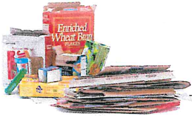
Flattened Cardboard & Paperboard Cartón y cartulina aplastados