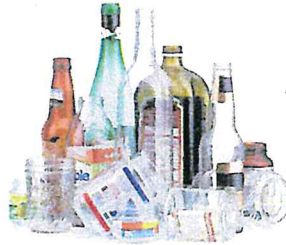
Glass Bottles & Containers Botellas y envases de vidrio