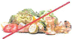
NO Food or Liquids NO comida o líquidos