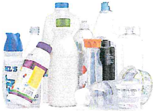
Plastic Bottles & Containers Botellas y envases de plástico