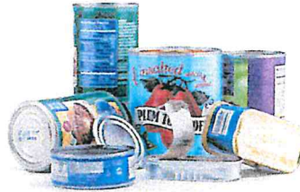
Food & Beverage Cans Latas de alimentos y bebidas