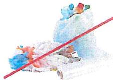
NO Loose Plastic Bags, Bagged Recyclables or Film Empty recyclables directly into your bin. NO bolsas y envolturas de plástico sueltas, o materiales reciclables embolsados Vací directamente los materiales reciclables en nuestro carrito