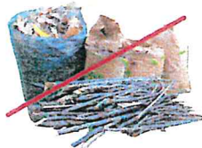
NO Green Waste NO desechos verdes